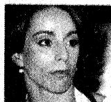
Της Ολυμπιονίκου ΒΟΥΛΑΣ ΠΑΤΟΥΛΙΔΟΥ

Θα μπορούσε βέβαια και έτσι να ερμηνευτεί. Η πραγματικότητα βέβαια είναι άλλη και μάλιστα μία, μόνη και αδιαπραγμάτευτη. Η Ολυμπιακή φλόγα και τα μάρμαρα του Παρθενώνα είναι